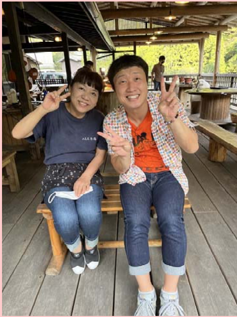
窓口さんとツーショット